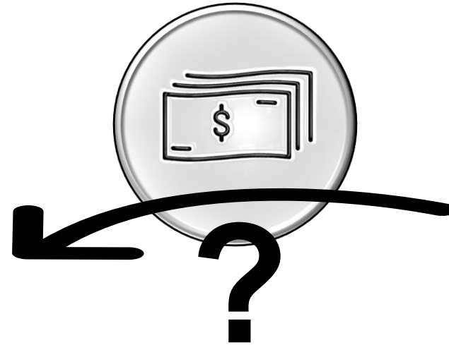
Instituciones financieras y fondos