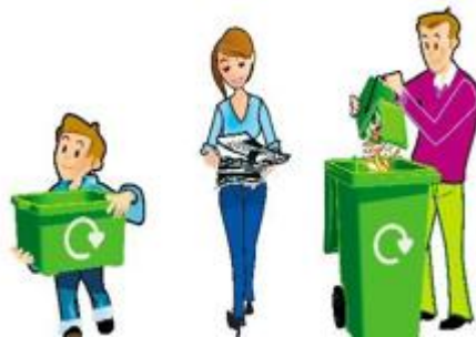
Separación de residuos valorizables en el origen